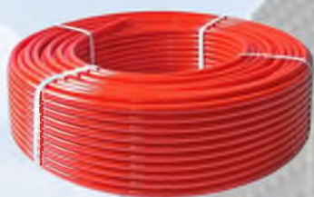
Труба из сшитого полиэтилена Giakommini PE-Xb 16x2 мм.