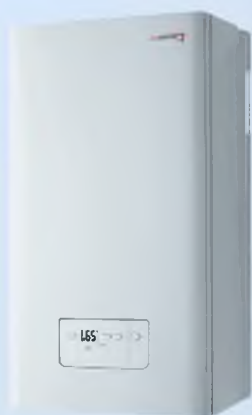
Газовый котёл Protherm MTV 23 (23 кВт)