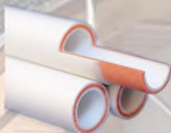
Полипропиленовые трубы, армированные стекловолокном

Общая стоимость системы отопления 200 т.р.